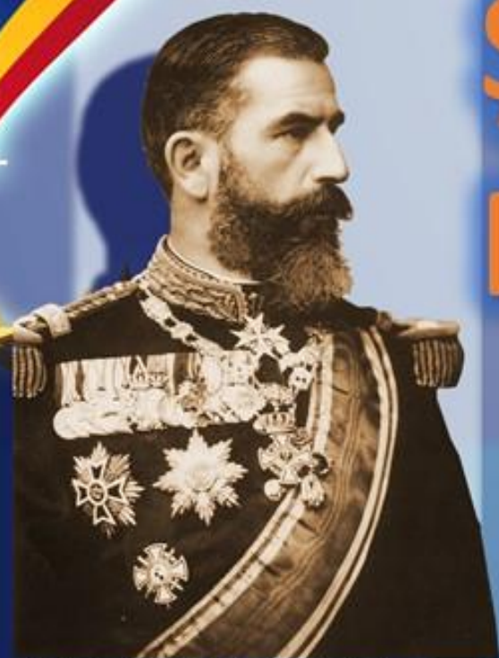
Carol I al României